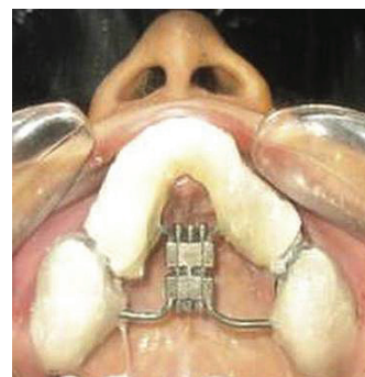
FIGURE 1. Intra-oral tooth-borne screw appliance.

incision is made from first molar to another molar. The mucoperiosteum is reflected to expose the maxillary bone up to the infraorbital foramen. A buccal linear osteotomy cut is made on both sides at a similar level with a 701 bur under copious irrigation above the level of the root apices from the pyriform rim to the predetermined distraction site between the premolars and molars parallel to the occlusal plane. Lateral nasal osteotomies are used to cut the lateral nasal wall from the pyriform rim at the same level of the buccal cut on both sides. Care is taken to protect the nasal mucosa. The nasal septum is then transected at its base just beyond the distraction site using a guarded septal