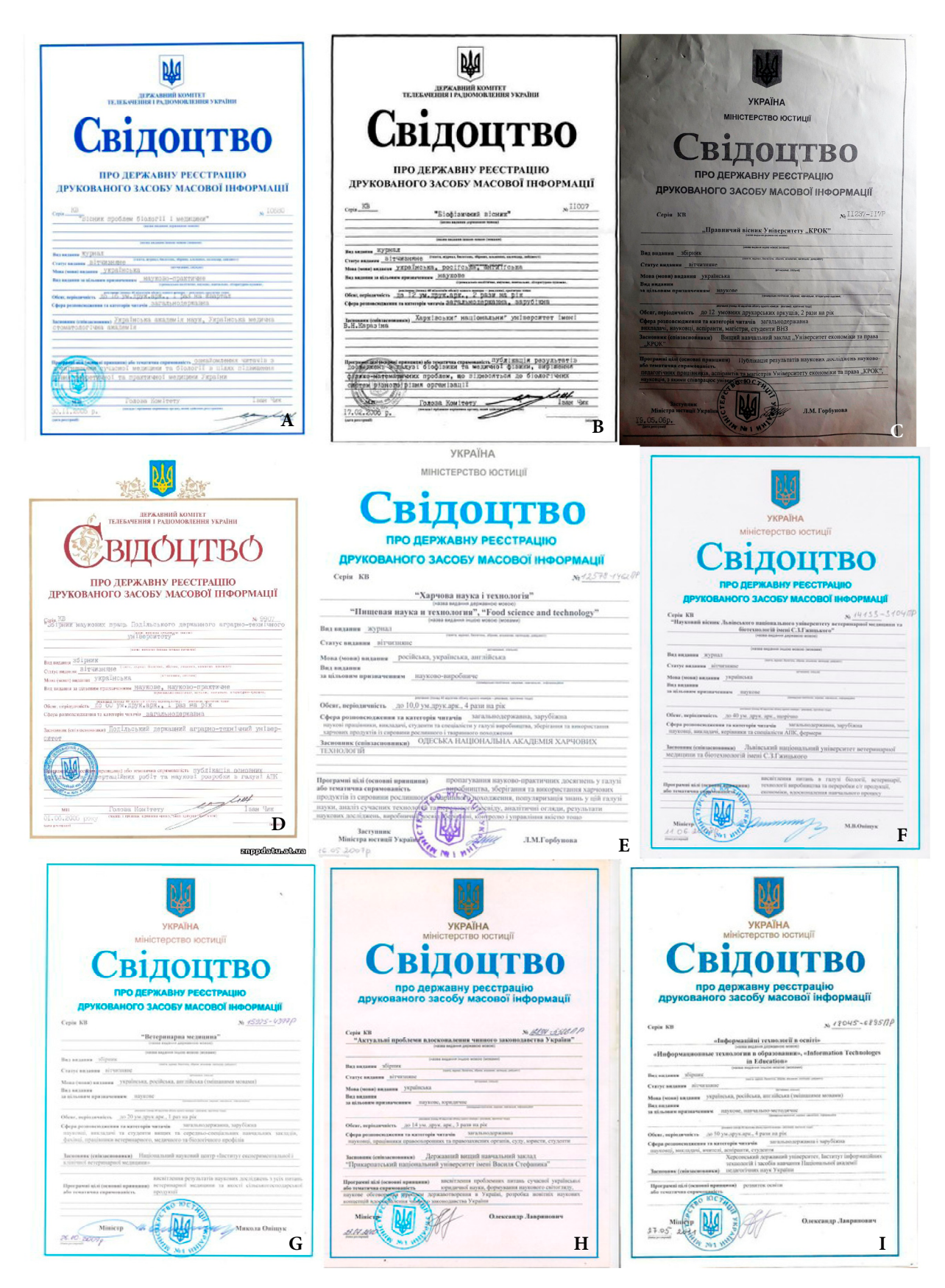
FIGURE 8. Certificates of state registration of the print mass media, the print peer-reviewed journals, from November 2005 to May 2011 (A–I).