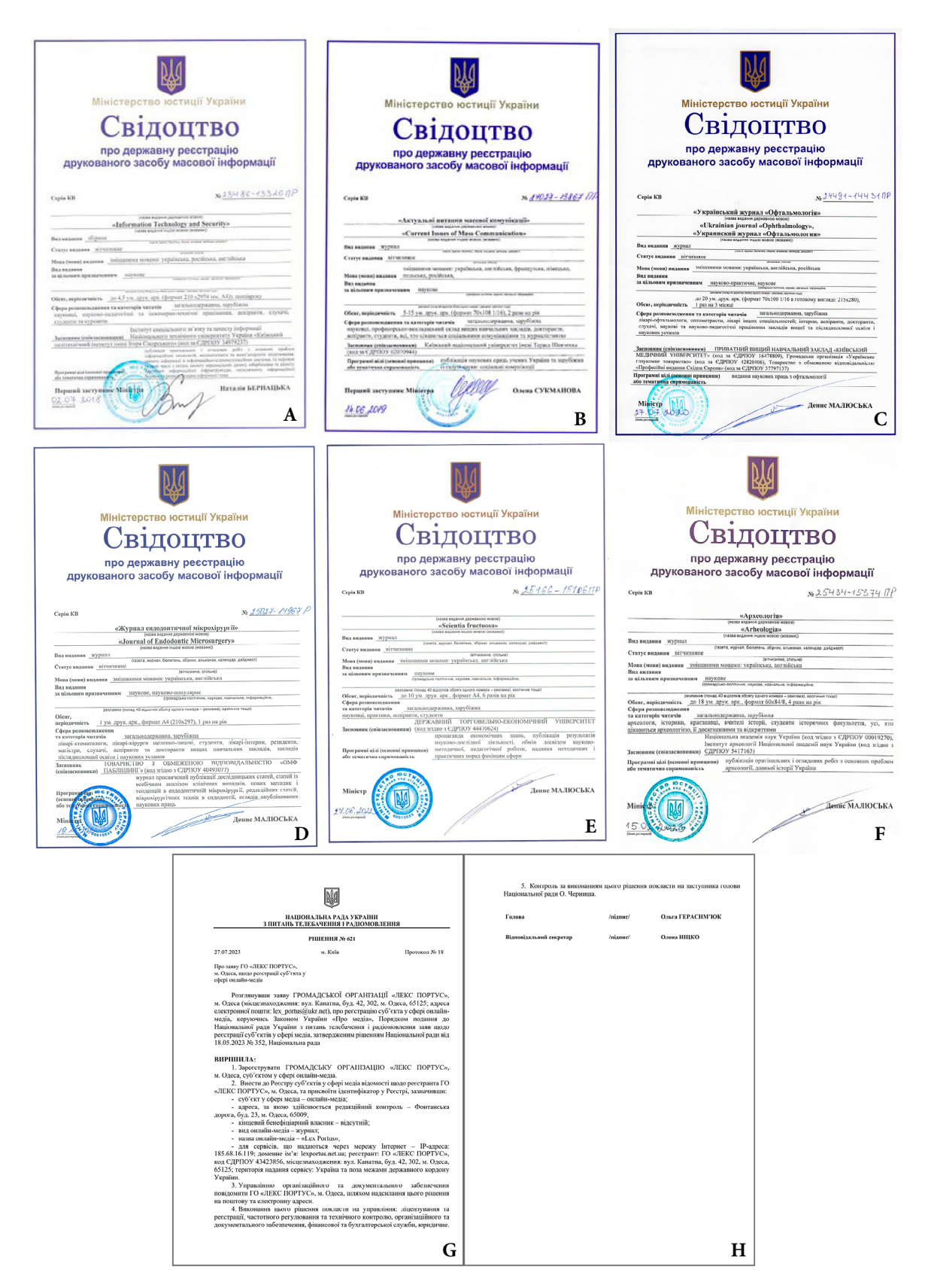
FIGURE 10. Certificates of state registration of the print mass media, the print peer-reviewed journals, from July 2018 to February 2023 ( A – F ) and Decision of state registration of the online media, online version of the print peer-reviewed journal, in July 2023 ( G and H ).