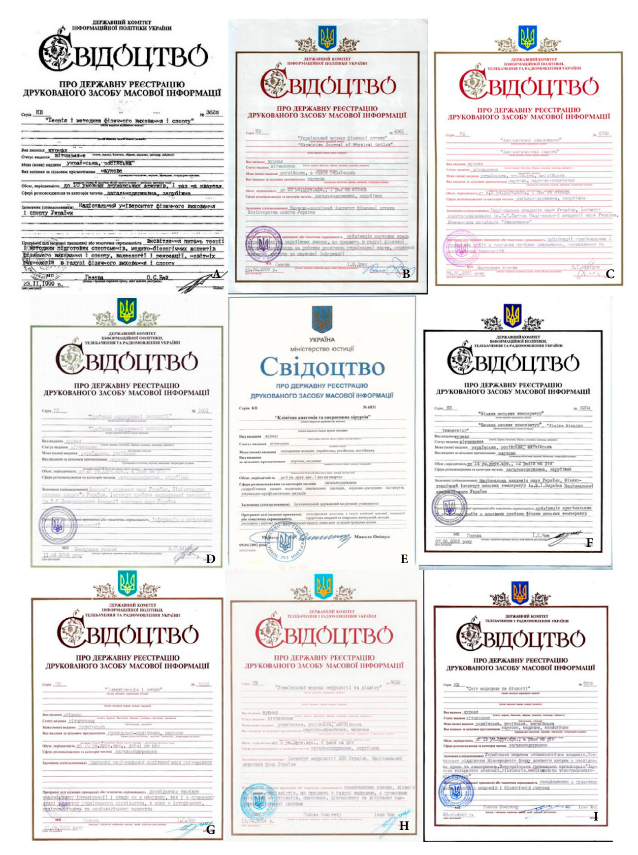
FIGURE 7. Certificates of state registration of the print mass media, the print peer-reviewed journals, from November 1999 to May 2005 (A–I).