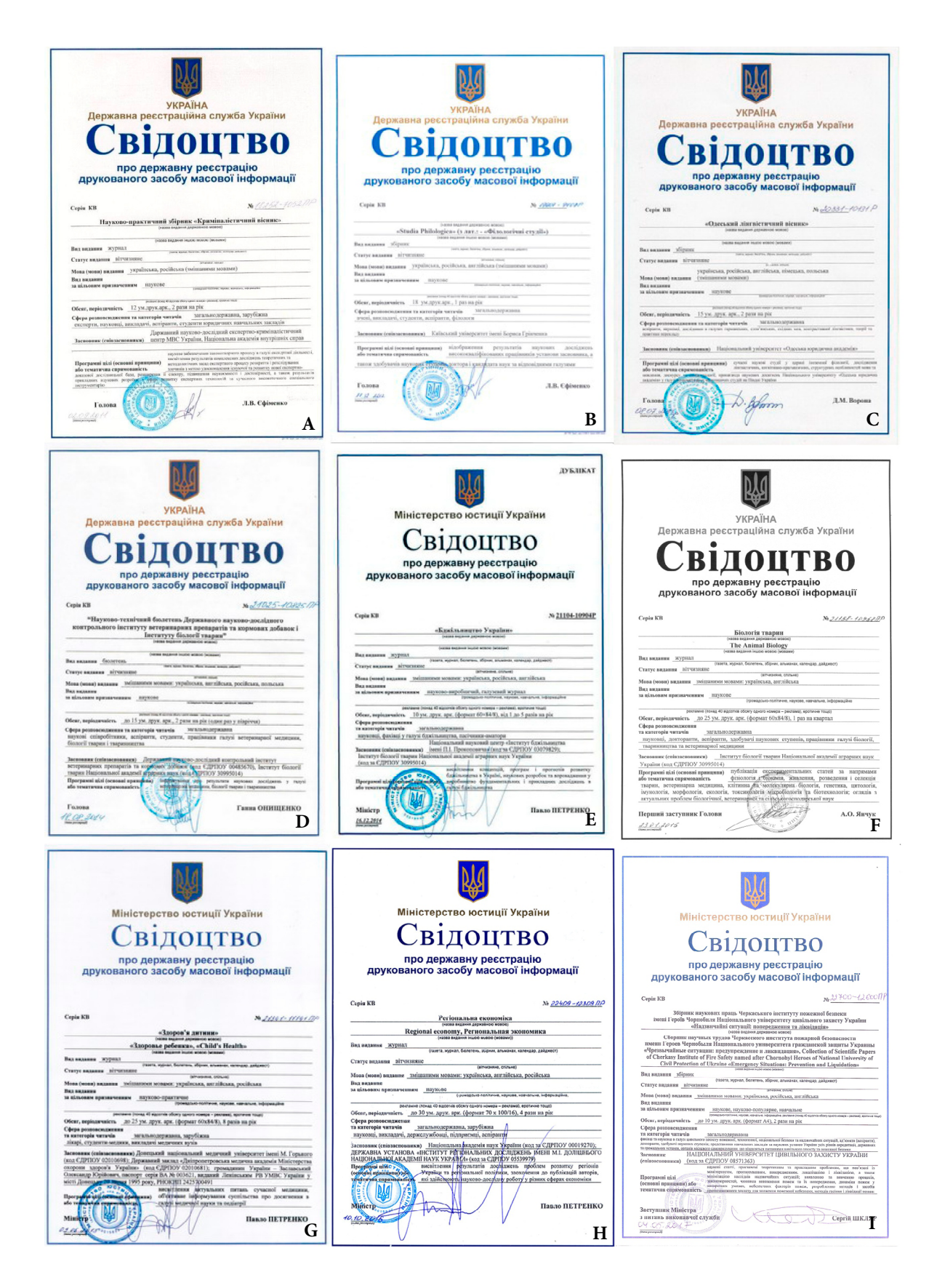
FIGURE 9. Certificates of state registration of the print mass media, the print peer-reviewed journals, from September 2011 to May 2017 (A–I).