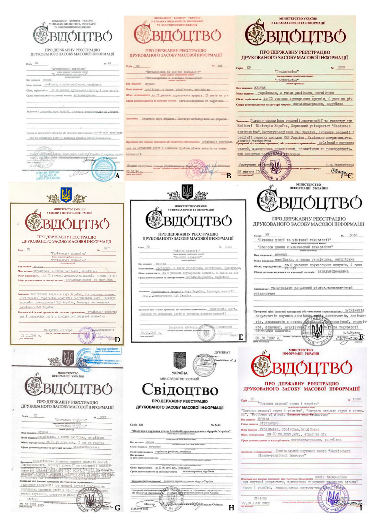
FIGURE 6. Certificates of state registration of the print mass media, the print peer-reviewed journals, from September 1993 to October 1998 (A-I).